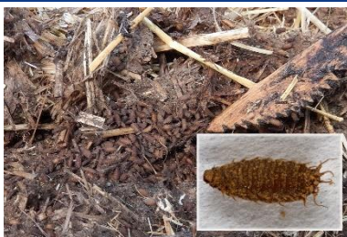
Hob af pupper i halm og forstørret puppe