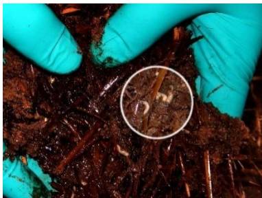
De glinsende, hvide, livlige maddiker af fluen Hydrotaea dentipes i det fugtige gødnings-blandede halm på jorden under minkburene.