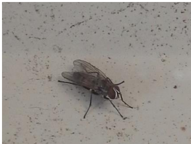
Lille stueflue, Fannia canicularis (han)