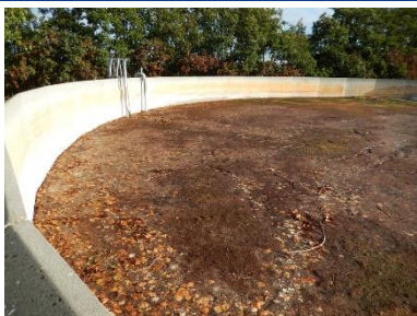
Eksempel på et ensartet, tæt flydelag i en stor gyllebeholder. Hvis der er et problem med lille stueflue på farmen, er det ikke her fluerne kommer fra.