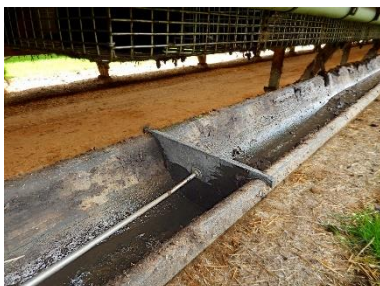
Gyllerrende, som løbende bliver grundigt skrabet – også oppe på siderne og på kanterne.