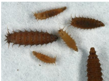
Larver af lille stueflue fra minkgødning.