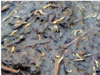
Larver af svingefluer ( Sepsidae ), som er kommet op og ligger ovenpå et flydelag, der er blevet helt vandmættet pga. nogle kraftige skybrud.