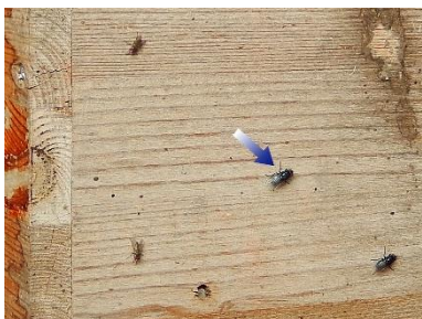
Et par blåsorte spyfluer i minkhal (pil). De to mindre fluer til venstre er lille stueflue.