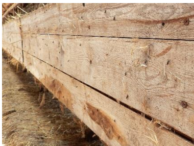
Her sidder fluerne, som små sorte pletter, hele vejen hen af redeskasserne.