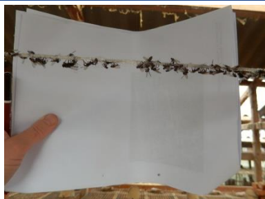
Voksne fluer fanget på limsnøre i minkhal