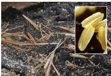
Æg på gødning og æg set i forstørrelse.