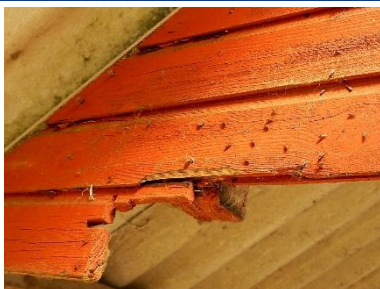
En solbeskinnet gav, hvor fluerne gerne søger hen.