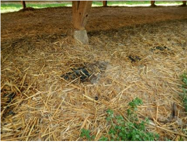
Ideelle betingelser for æg og larver i fugtig, gødningsblandet halm under bure.