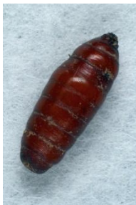
Den brune, glatte, ca. 8 mm lange tøndepuppe af fluen Hydrotaea dentipes .