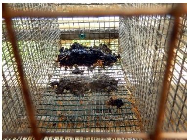
Frisk og gammel gødning på et ca. 4 uger gammelt hvalpenet. En prøve på 85,6 g gødning fra et 2 uger gammelt hvalpenet, indeholdt 363 små larver af lille stueflue.