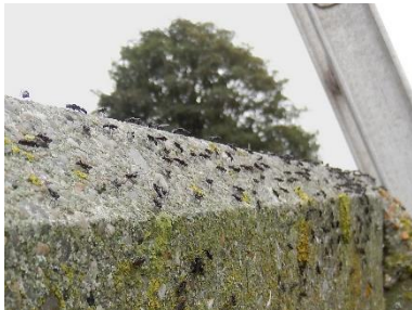
Svingefluer, som er klækket fra pupper i flydelaget og nu sidder i stort antal på kanten gyllebeholderen.