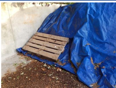
Tætssluttende, kraftig presenning over fastgødning på møddingplads