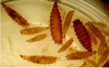
Små og store larver af lille stueflue.