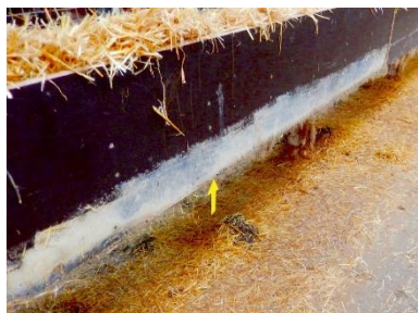
Her er smøremiddel (gul pil) rullet på i en bred stribe nederst på redekasserne.